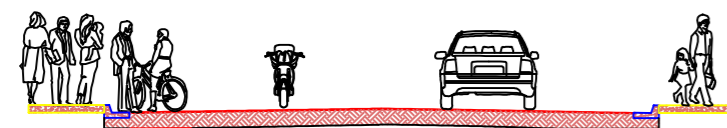
PERFIL TRANSVERSAL escala 1/150

SERVIÇOS: 1. Recapeamento em CBUQ e=3,0cm;