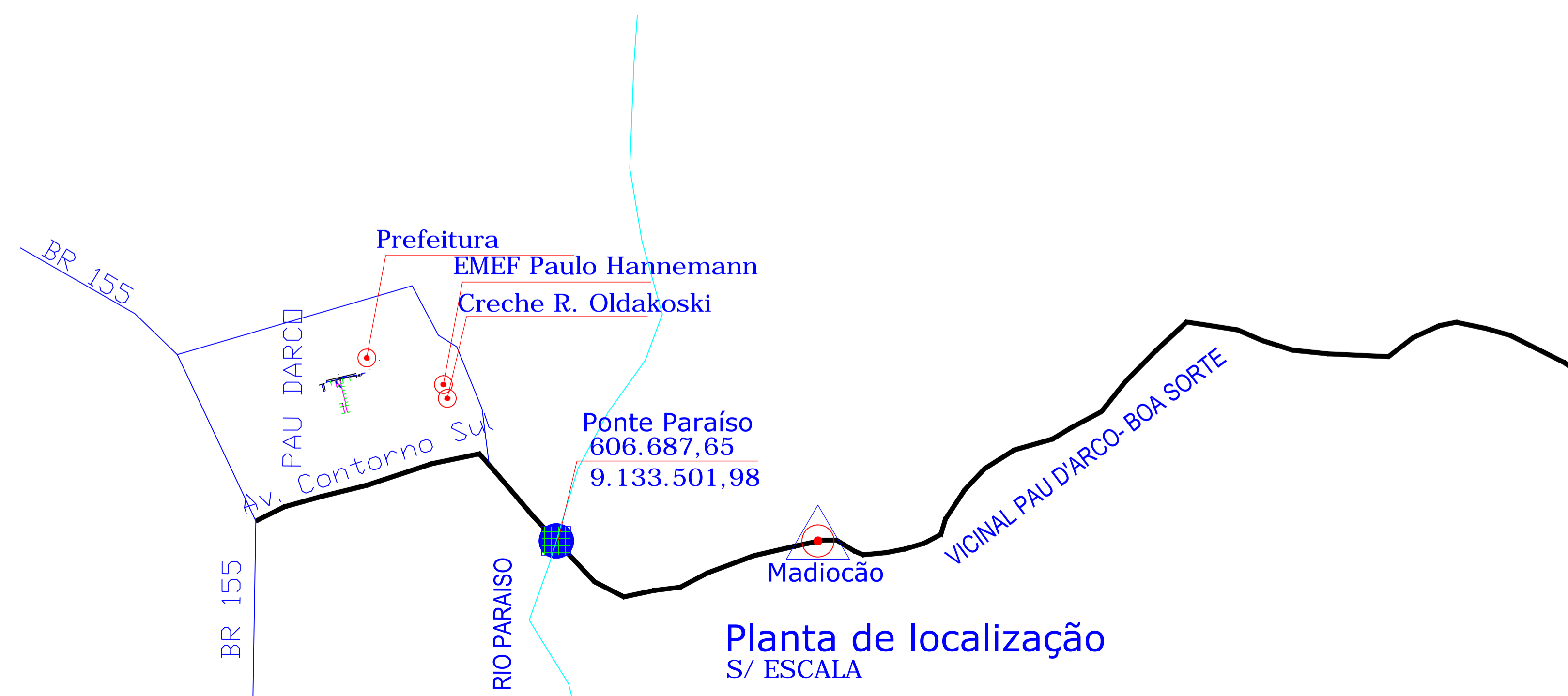
Planta de localização S/ ESCALA